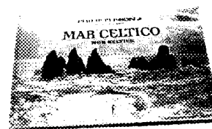
Mar Celtico. Mor Keltiek , di Philip Plisson, testi di Patrick Mahé, L'ippocampo, pp. 240, € 39,90.

soprattutto ce ne mostra la luce e i colori, così diversi da quelli del Mediterraneo: il blu scuro e il grigio fondo delle acque e attorno verde, tanto verde, dalla Scozia alla Cornovaglia, dall'Irlanda alla Bretagna. Tutte terre di marinai e di velisti, abituati alle onde agitate che Mar Celtico saprà farvi amare.