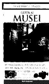
Guida ai musei , di G. Crepaldi, Mondadori, pp. 369, € 23.

» Dalla collana Scoprire l'Italia , una dettagliatissima guida a 400 musei, dai più celebri ai più singolari, con tutte le info utili e aggiornate, cartine geografiche, curiosità e approfondimenti su opere, artisti, location espositive ed eventi. Lo strumento più adatto, insomma, per chi ama scoprire i tesori d'Italia nel campo dell'arte, della storia naturale, dell'archeologia, della scienza e tecnologia