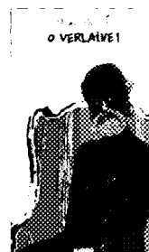
O Verlaine! , di Jean Teulé, Nutrimenti, pp. 304, € 17.

» Parigi, 1865. La storia (vera) di un giovane contadino di Béziers che attraversa la Francia per incontrare Paul Verlaine, il suo idolo, e lo trova in un bordello, ricoperto di insetti. Da quel momento il ragazzo non lascia più il poeta fino alla sua morte, qualche mese più tardi, e lo protegge da nemici e approfittatori. Un romanzo appassionante che ci fa conoscere la combriccola di poeti e artisti della Ville Lumière alla fine dell'800.