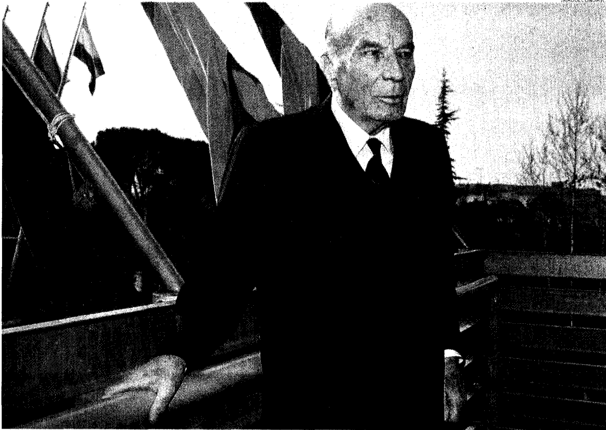
Timoniere. Guido Carli fotografato nel 2001