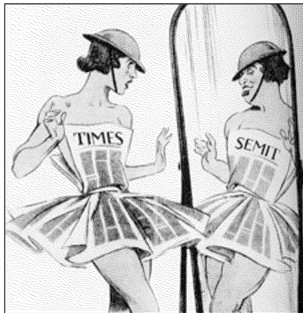
Un disegno pubblicato dalla «Difesa della razza» nel 1941