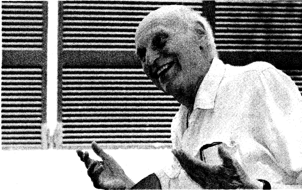
Yona Friedman, 86 anni, pubblica da Bollati Boringhieri Architettura di sopravvivenza