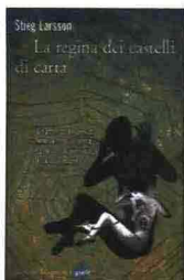
La regina dei castelli di carta di Stieg Larsson (Marsilio)

A me Uomini che odiano le donne , La ragazza che giocava col fuoco e l'ultimo, La regina dei castelli di carta , sono piaciuti moltissimo e mi dispiace proprio che Larsson sia morto e che il suo bel gioco narrativo sia durato alla fine dei conti (e malgrado le duemila pagine complessive) così poco. Che crisi di astinenza. ←