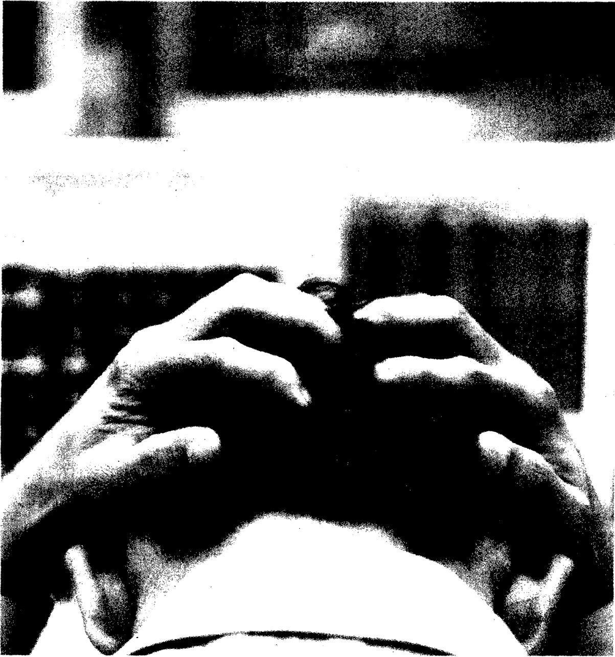
> Un broker disperato per il tracollo alla borsa di Mumbai > (foto Reuters)