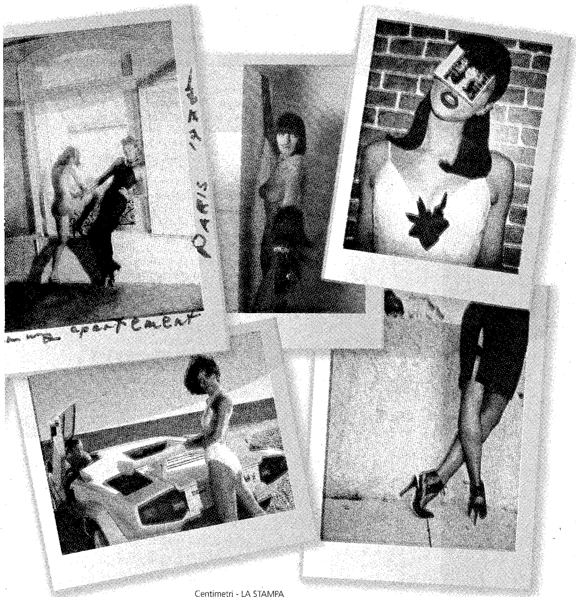
Centimetri - LA STAMPA

✦ invece di macerarle, dopo aver fissato le modelle sui rullini definitivi. Oggi quelle Polaroid ci raccontano la nascita di uno stile, per Vogue, Playboy o altre riviste, e trasfondono anche le sfumature, molto vintage, d'un'altra era dell'opera d'arte e della sua riproducibilità.