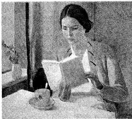
Aleksandr Denieka «Donna che legge» (1934)

Le donne leggono per vivere di più, e quale vita scelgano è sempre un piccolo mistero che ciascuna svela fino in fondo soltanto a se stessa.