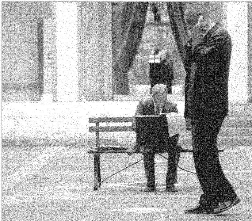
A Milano manager e lavoratori reali e virtuali