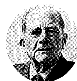
Un busto di Socrate e, sotto, Carl Schmitt