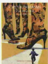
VIA CON ME Castle Freeman MARCOS Y MARCOS pp. 208 euro 14,50 Traduzione di Daniele Benati

In un angolo dimenticato del Vermont rurale - sotto l'occhio vigile dei «filosofi» della comunità, un gruppetto sgangherato di vecchietti pettegoli che si riunisce nella segheria in disuso - una ragazza, piccolina ma testarda e coraggiosa, proprio non ci sta a farsi terrorizzare dal bullo di turno, un autentico delinquente temuto per le sue efferate angherie. Così, invece di scappare via - contro il consiglio di tutti, compreso lo sceriffo, che vuole soltanto evitare grane - decide di affrontare il suo persecutore, aiutata solo da un ragazzone tutto muscoli e poco cervello, e da un anziano bisbetico, ma scaltrissimo. Tra situazioni a tratti comiche e momenti di tensione degni dei migliori thriller, la vicenda si dipana con avvincente rapidità, verso il suo inaspettato finale tra i boschi selvaggi. Castle Freeman , uno degli scrittori statunitensi più brillanti degli ultimi anni, ci regala un piccolo gioiello da leggere d'un fiato, ricco di dialoghi fulminanti, descrivendoci un'America insolita, con la sua umanità impoverita e spesso brutale. (diego brasoli)