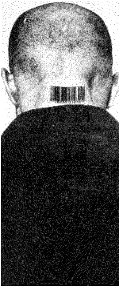
Jana Sterbac «Generic Man», 1987-89