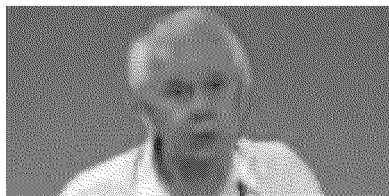
IAN STEWART NATO IN INGHILTERRA NEL 1945 DOCENTE DI MATEMATICA ALLA WARWICK UNIVERSITY

Un prof che insegna anche come tagliare una torta