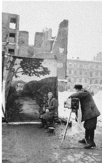
Le rovine Una donna si fa fotografare su uno sfondo idilliaco a Varsavia nel 1946. Dietro la città distrutta